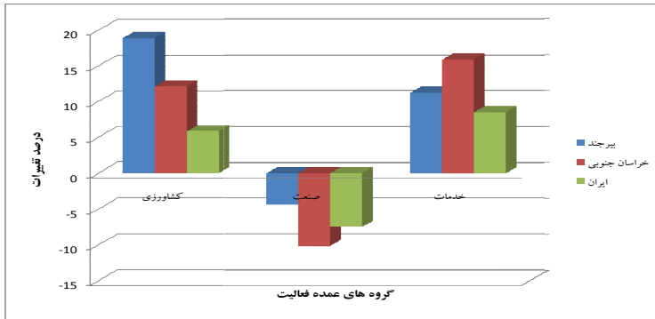
شکل ۲. تحلیل موقعیت اقتصادی شهرستان بیرجند در سال‌های ۱۳۸۵-۱۳۷۵