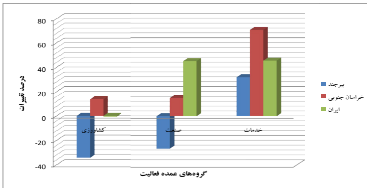
شکل ۳. تحلیل موقعیت اقتصادی شهرستان بیرجند در سال‌های ۱۳۹۰-۱۳۸۵